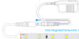
Схема подключения одноцветной ленты с помощью коннекторов

последовательное подключение не более 10 метров