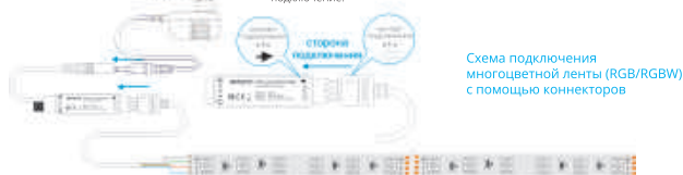
Схема подключения многоцветной ленты (RGB/RGBW) с помощью коннекторов

Светодиодная лента 24 В подключается последовательно не более 10 метров. Для подключения большого количества лент используйте параллельное подключение.